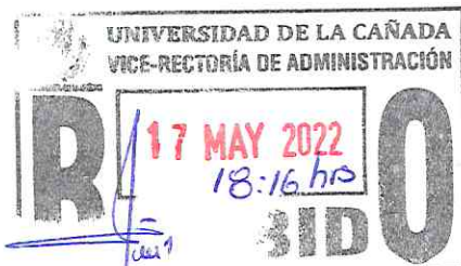
M.I.A ISRAEL ÁLVAREZ VELÁSQUEZ PROFESOR-INVESTIGADOR